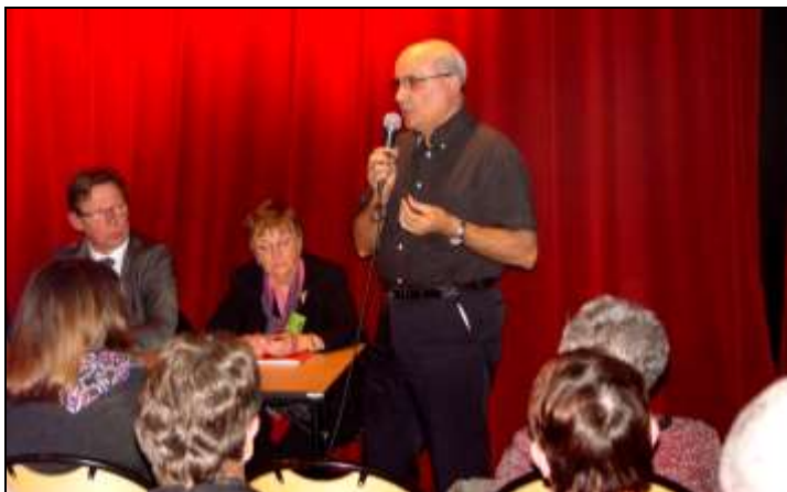
Le coût des ordures ménagères et leur ramassage