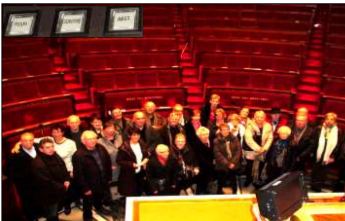
L'hémicycle et les boutons de vote