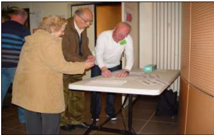
A l'accueil, signature de la feuille de présence,