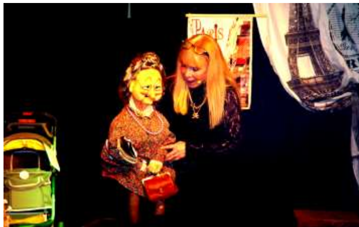
Divertissement avec la ventriloque et ses marionnettes