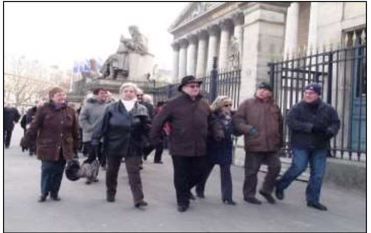
Il fait froid mais on y va