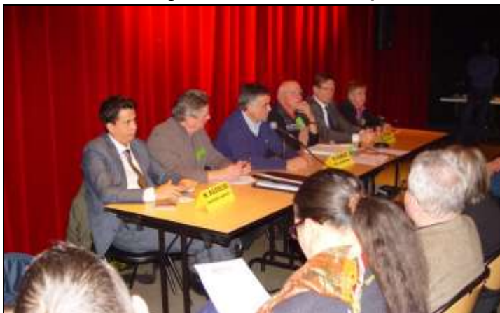
Les intervenants du bureau et des invités