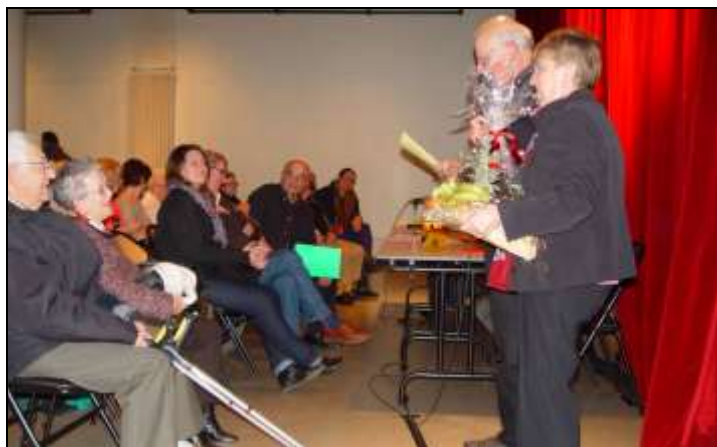
Bon anniversaire pour ce couple d'amicalistes assidus