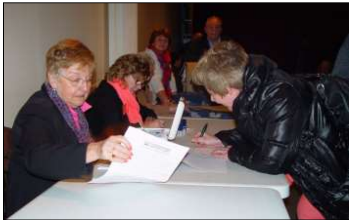
échange avec la Trésorière et remise du cadeau