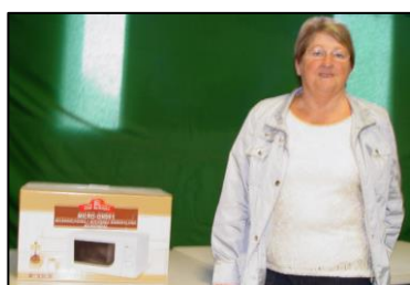
La gagnante du 15-10-2017

Date de notre premier LOTO, retenez bien cette date : le dimanche 8 avril 2018.