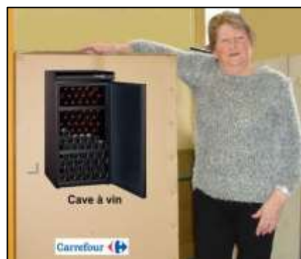
La gagnante du lot de 600 €