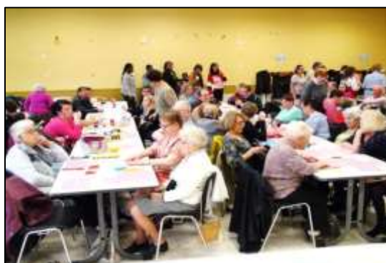
A l'entracte boissons et gâteaux