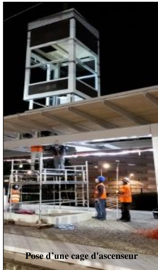
Pose d'une cage d'ascenseur

En projet mi 2022 : la modernisation et mise en accessibilité de l'accès secondaire côté sud ainsi que la mise en place d'un micro-working (espace de travail avec Wi-Fi) dans le bâtiment principal.