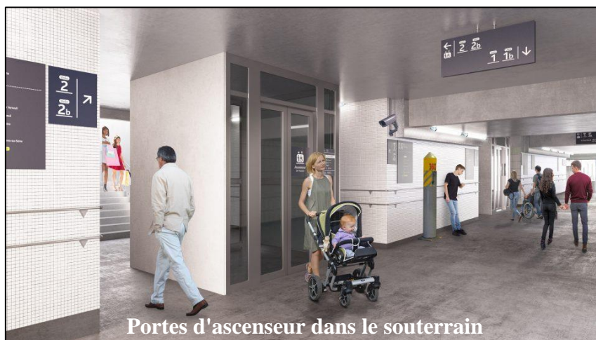
Portes d'ascenseur dans le souterrain