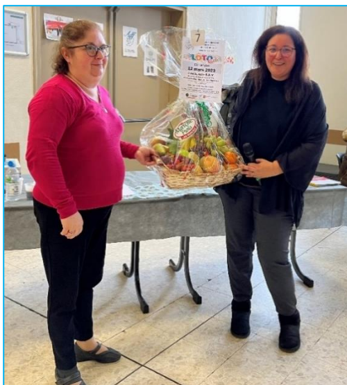
Le panier de fruits de l'Entrepôt

Une belle participation avec plus de 90 joueurs.