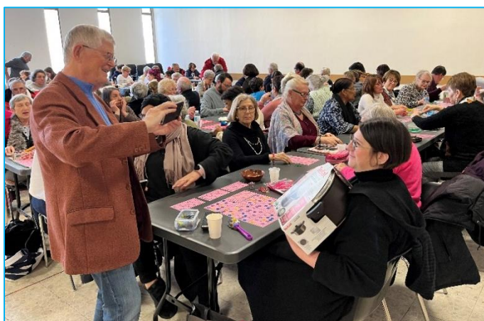
La salle S.R.V. bien remplie