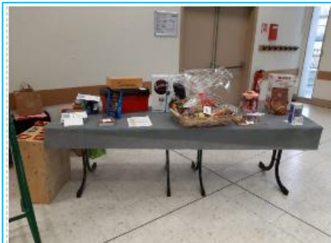
La table des lots