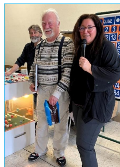
Le chocolat de Cacao Barry + deux places de spectacle