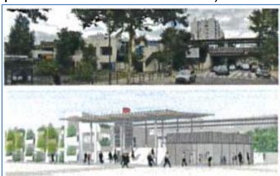
Modernisation et mise en accessibilité de l'accès côté sud

Travaux restant à réaliser d'ici 2024 et +: Démolition du poste d'aiguillage pour allongement du quai nord et rénovation du bâtiment voyageurs (Le prolongement d'Eole jusqu'à Mantès a pris du retard avec le Covid).