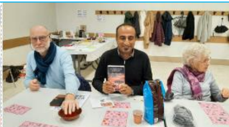
Un repas à la villa César et du chocolat Barry-Caillebaut