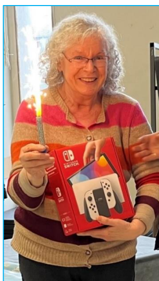
Notre gros lot : une Switch Nintendo