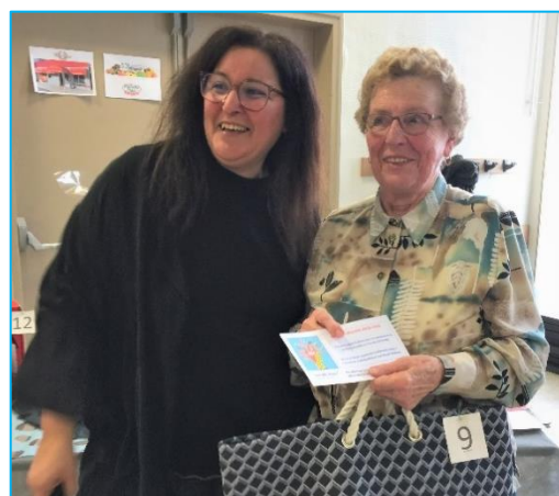
Un service à foie gras + un sac + deux places de spectacle