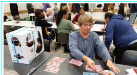
une cafetière Senseo et 2 places de spectacle