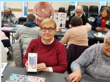
notre gagnante du gros lot : un téléphone portable