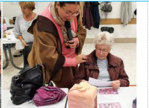
Un coffret des parfums Adopt et 2 places de spectacle