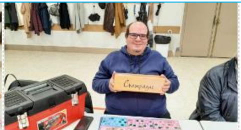
un coffret de champagne offert par Adf